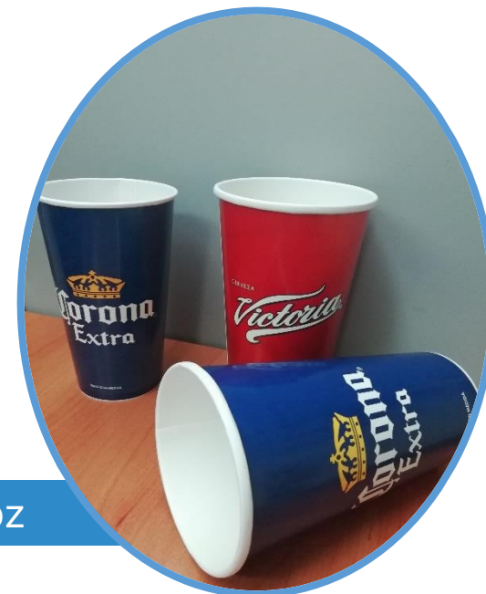
32oz y 44oz